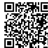
桃園市公立及非營利幼兒園 招生網