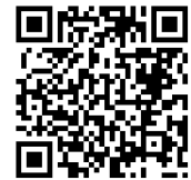
桃園市公立及非營利幼兒園 招生網